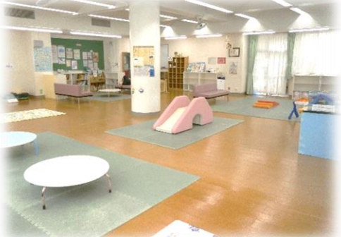
ひろびろと遊べます!