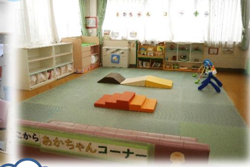
あかちゃんコーナー